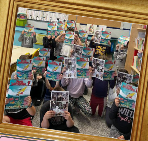
Mil Dimonis a l'escola d'Illa