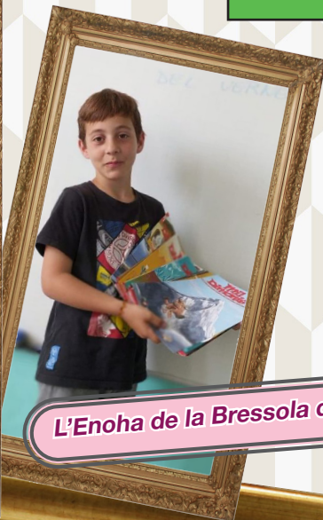
L'Enoha de la Bressola del Vernet