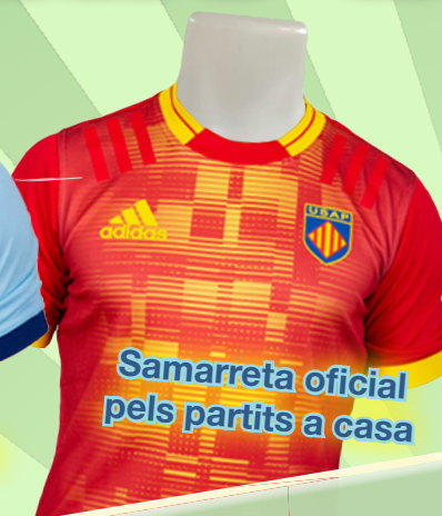
Samarreta oficial pels partits a casa