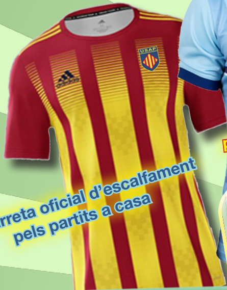
Samarreta oficial d'escalfament pels partits a casa