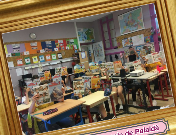
Mil Dimonis a l'escola de Palaldà