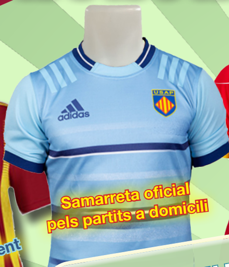
Samarreta oficial pels partits a domicili